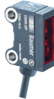
图片与实际产品类似