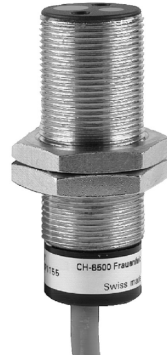
图片与实际产品类似