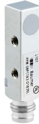
图片与实际产品类似