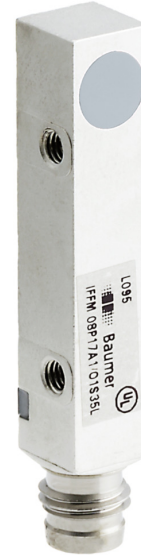
图片与实际产品类似