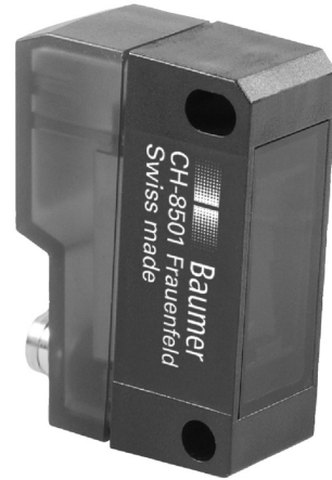
图片与实际产品类似