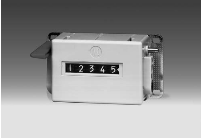
U 411 - Compteur de tours