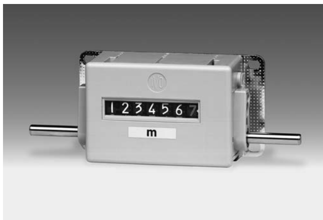
M 400 - Compteur métreur