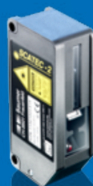
SCATEC-2 Gripper Le spécialiste de la préhension.