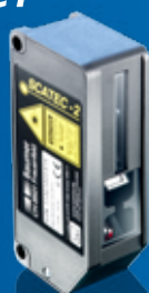
SCATEC-2 Le plus vendu.