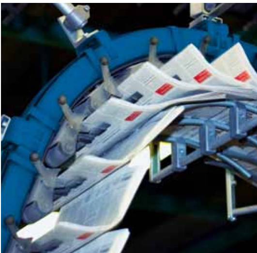
Comptage d'exemplaires sur un transport à pinces.

SCATEC vous permet de surveiller votre production de façon rapide, précise et sans erreurs.