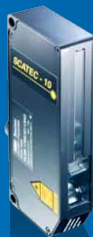
SCATEC-10 La classe de précision.