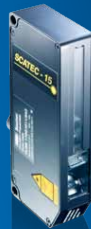
SCATEC-15 La classe de précision avec bus CAN.