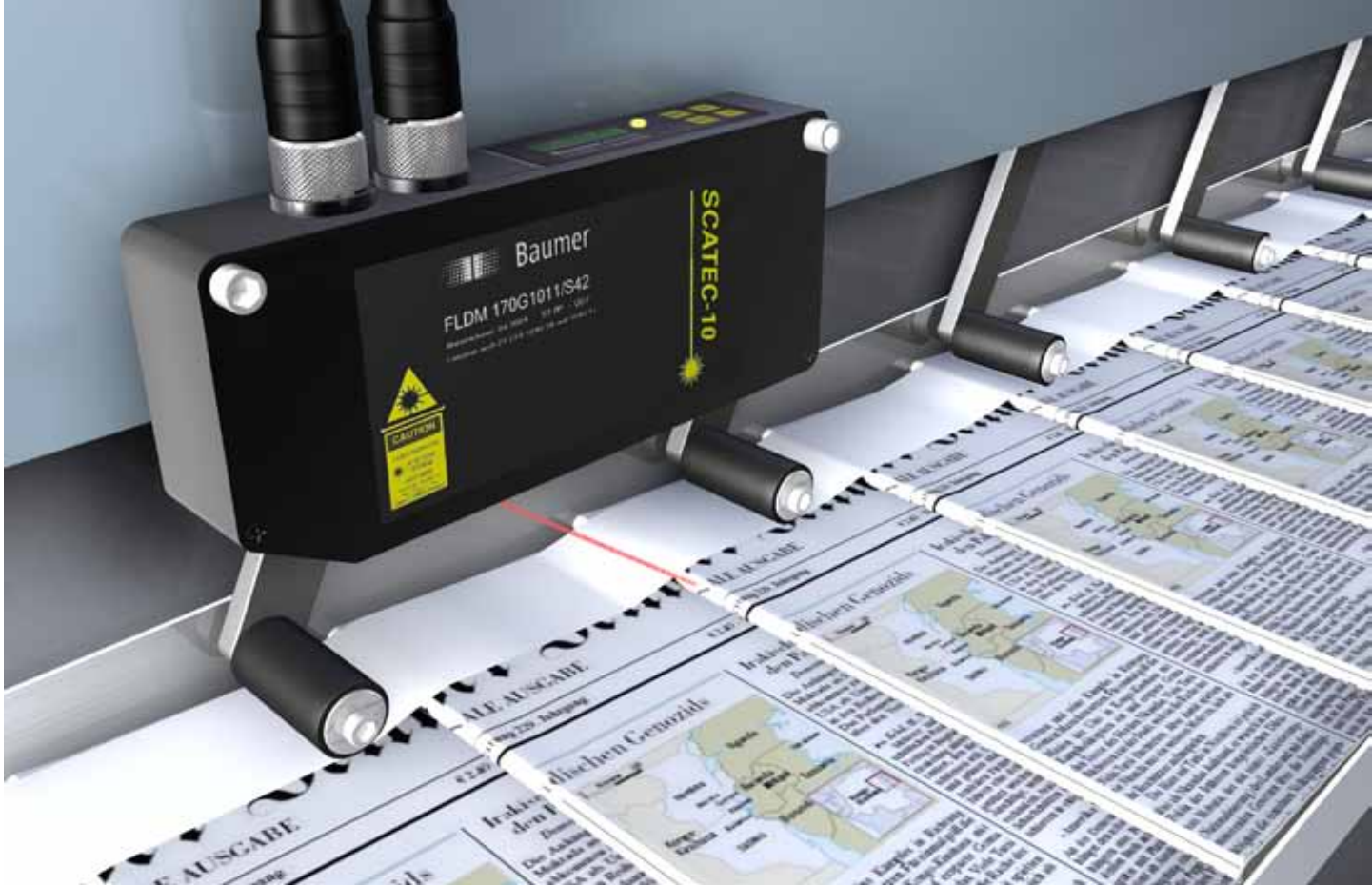
Comptage d'exemplaires en flux en nappe.