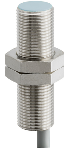
图片与实际产品类似