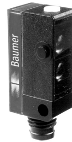
图片与实际产品类似