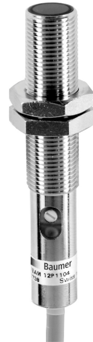
图片与实际产品类似