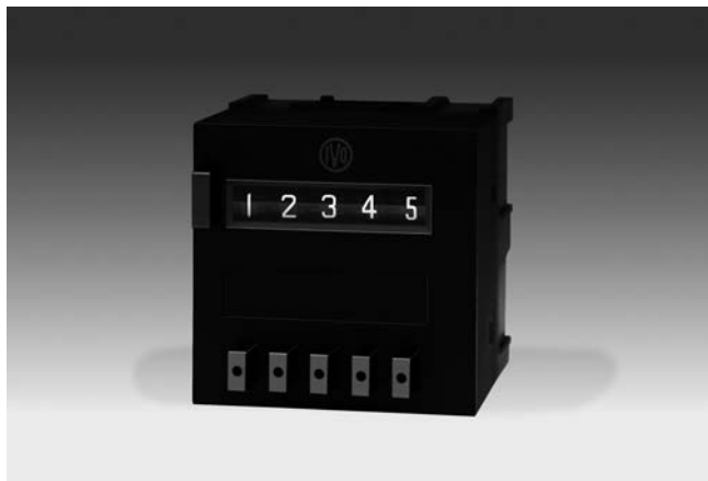
FS304 - Einschubgehäuse