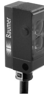
图片与实际产品类似