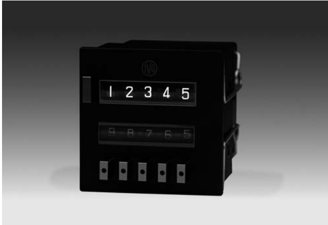
FE324 - Frontplatte mit Klemmfederbefestigung